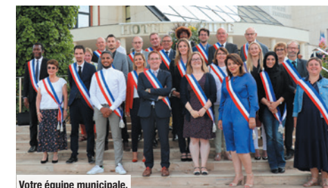
Votre équipe municipale.

Vous y trouverez une série de rendez-vous variés, pensés pour tous les goûts et toutes les envies. Après le succès de la précédente saison, nous avons souhaité vous offrir à nouveau des spectacles et manifestations de qualité. Vous le savez, la municipalité attache une importance particulière à la promotion de la culture, des talents et des rencontres.