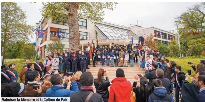
Valoriser la Mémoire et la Culture de Paix.