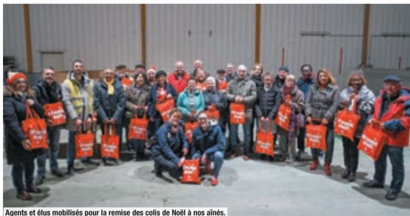
Agents et élus mobilisés pour la remise des colis de Noël à nos aînés.