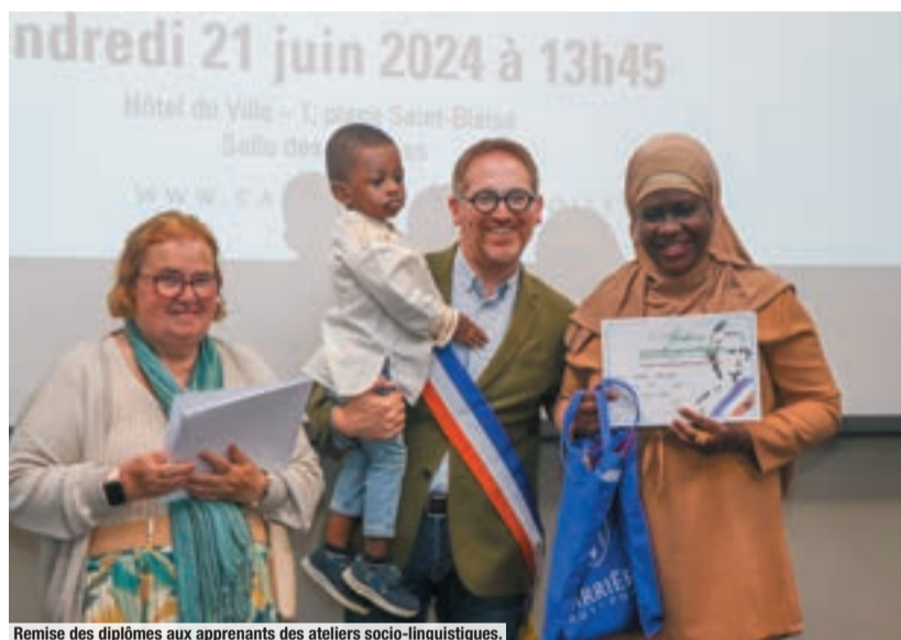
Remise des diplômes aux apprenants des ateliers socio-linguistiques.