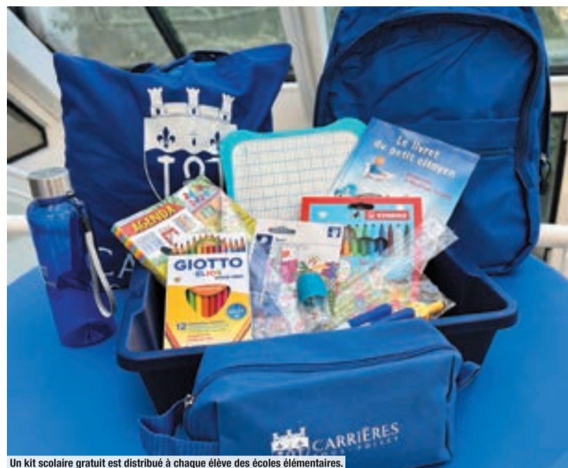
Un kit scolaire gratuit est distribué à chaque élève des écoles élémentaires.