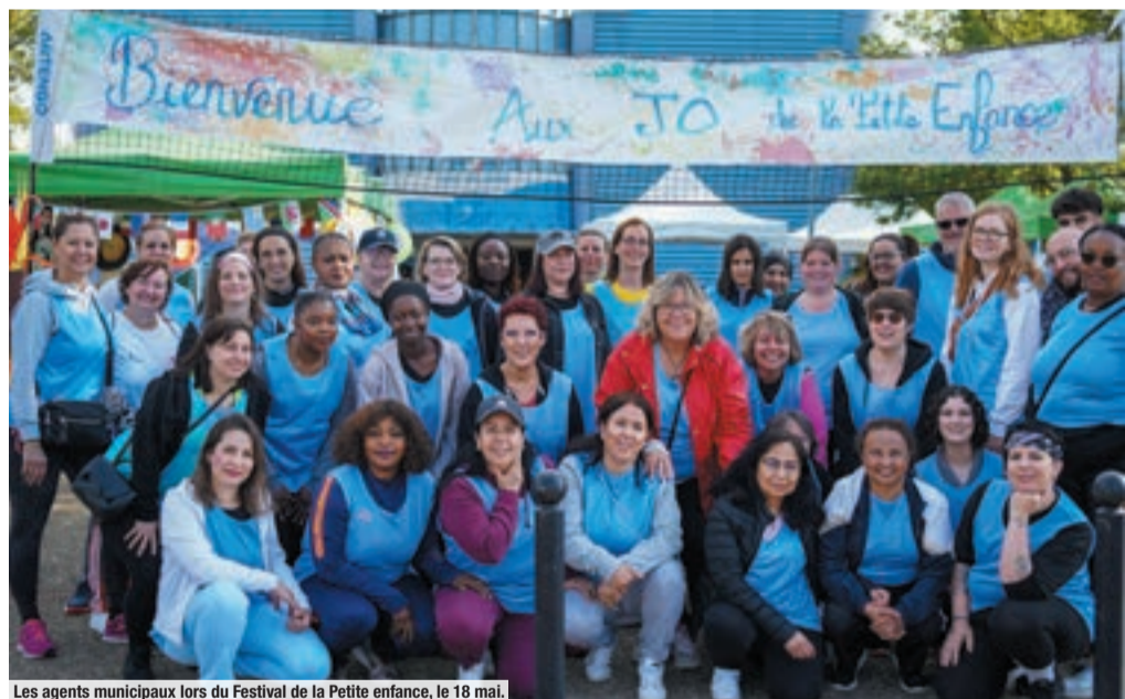
Les agents municipaux lors du Festival de la Petite enfance, le 18 mai.