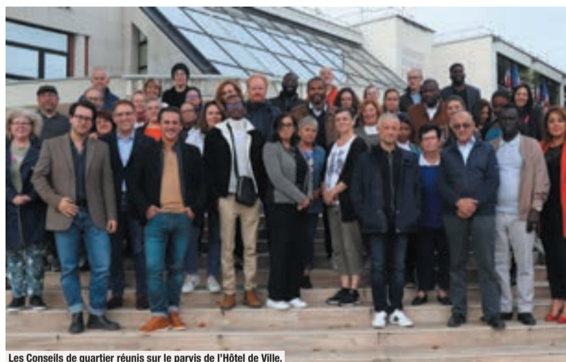
Les Conseils de quartier réunis sur le parvis de l'Hôtel de Ville.