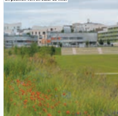
Un poumon vert en cœur de ville.