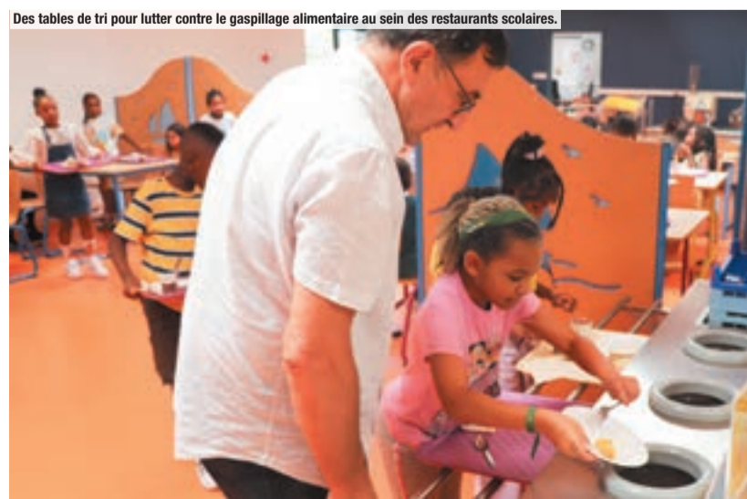
Des tables de tri pour lutter contre le gaspillage alimentaire au sein des restaurants scolaires.