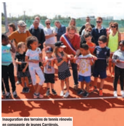
Inauguration des terrains de tennis rénovés en compagnie de jeunes Carriérois.