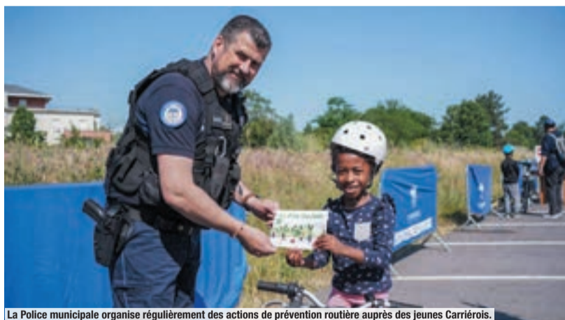
La Police municipale organise régulièrement des actions de prévention routière auprès des jeunes Carriérois.