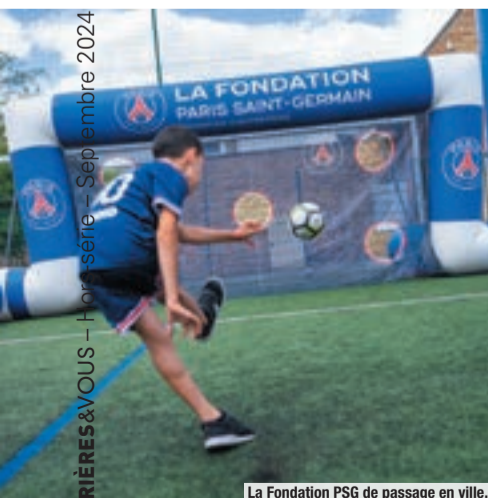
La Fondation PSG de passage en ville.