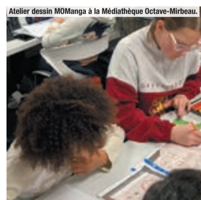
Atelier dessin MOManga à la Médiathèque Octave-Mirbeau.