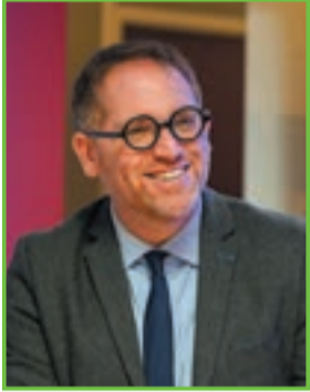
Eddie AïT Maire Vice-président de la Communauté Urbaine Grand Paris Seine & Oise

Toute correspondance doit être adressée à Monsieur le Maire Hôtel de Ville 1, place Saint-Blaise 78955 Carrières-sous-Poissy cabinet@carrieres-sous-poissy.fr – 01 39 22 36 00