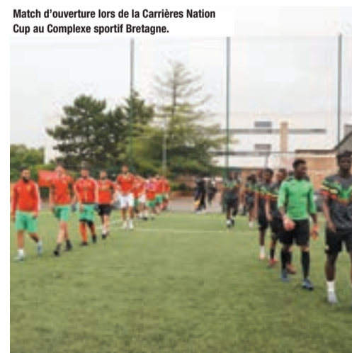
Match d'ouverture lors de la Carrières Nation Cup au Complexe sportif Bretagne.