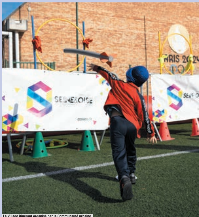
Le Village itinérant organisé par la Communauté urbaine.

Forte de sa labellisation « Terre de Jeux 2024 », la Ville a organisé plusieurs temps forts : un Village olympique avec la Fédération Française Handisport dans le cadre de la Semaine olympique et paralympique, l'accueil du Village olympique itinérant de la Communauté urbaine, des Olympiades pour les accueils de loisirs maternels et élémentaires, des rencontres sportives avec l'École municipale des sports et l'accueil du JOP Tour 78 proposé par le Comité départemental olympique et sportif français et l'État.