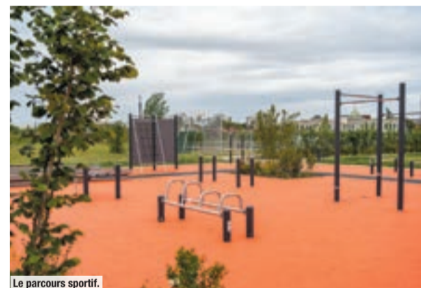
Le parcours sportif.