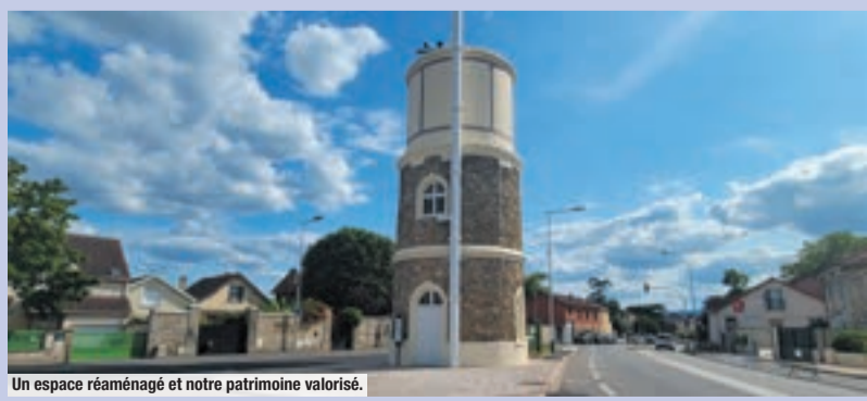
Un espace réaménagé et notre patrimoine valorisé.