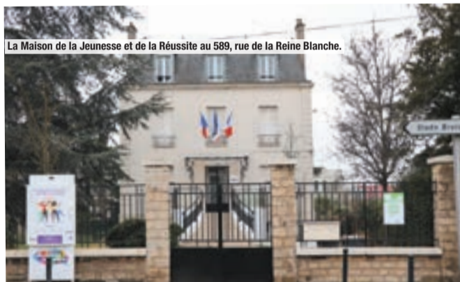
La Maison de la Jeunesse et de la Réussite au 589, rue de la Reine Blanche.