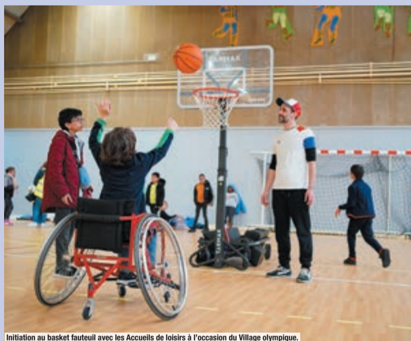
Initiation au basket fauteuil avec les Accueils de Loisirs à l'occasion du Village olympique.