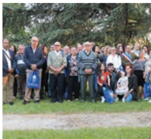
Rencontre avec les ressortissants européens résidant à Carrières-sous-Poissy.