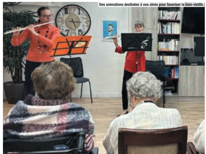
Des animations destinées à nos aînés pour favoriser le bien-vieillir.