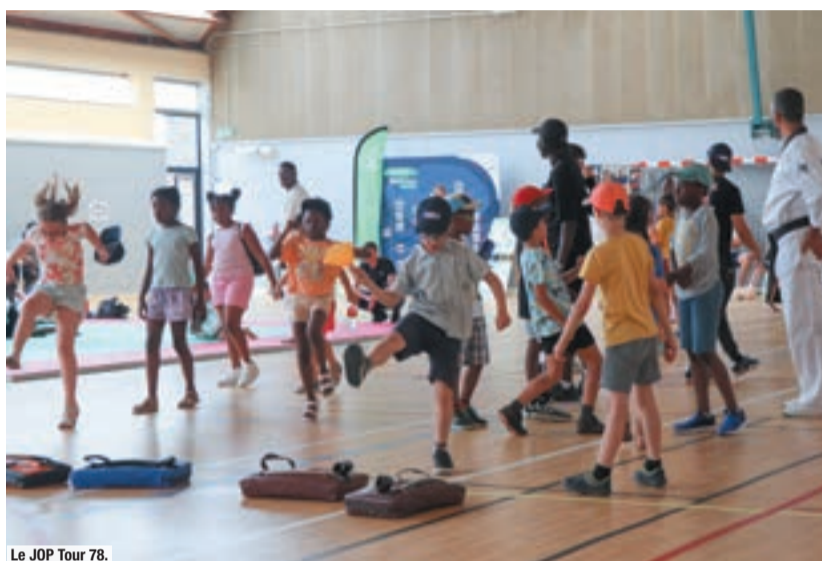
Le JOP Tour 78.