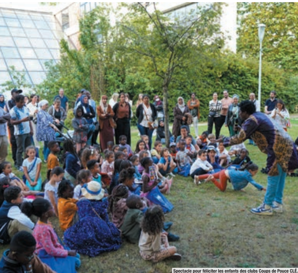
Spectacle pour féliciter les enfants des clubs Coups de Pouce CLÉ.