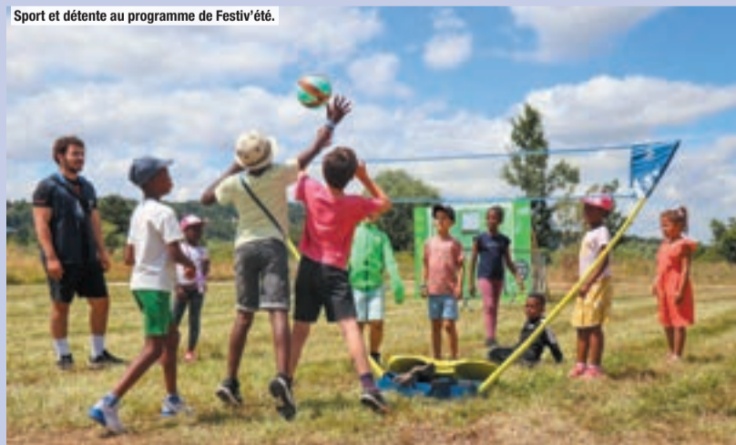
Sport et détente au programme de Festiv'été.

Chaque mois de juillet, la municipalité propose de nombreuses activités ludiques, sportives et solidaires coordonnées par le Centre social et culturel « Espace Rosa-Parks » dans les 3 quartiers de la Ville. Les ateliers proposés cette année sur le thème des Jeux Olympiques et Paralympiques ont rassemblé plus de 2 100 Carriérois, petits et grands, sur 6 demi-journées.