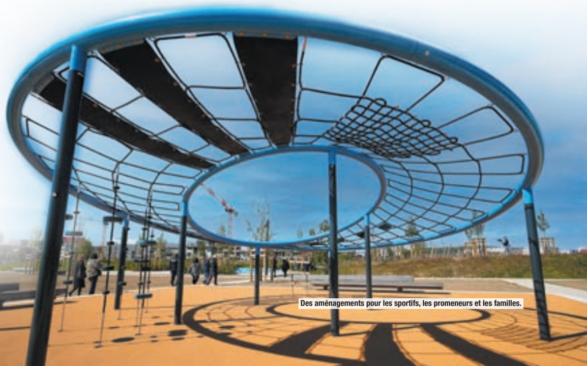
Des aménagements pour les sportifs, les promeneurs et les familles.