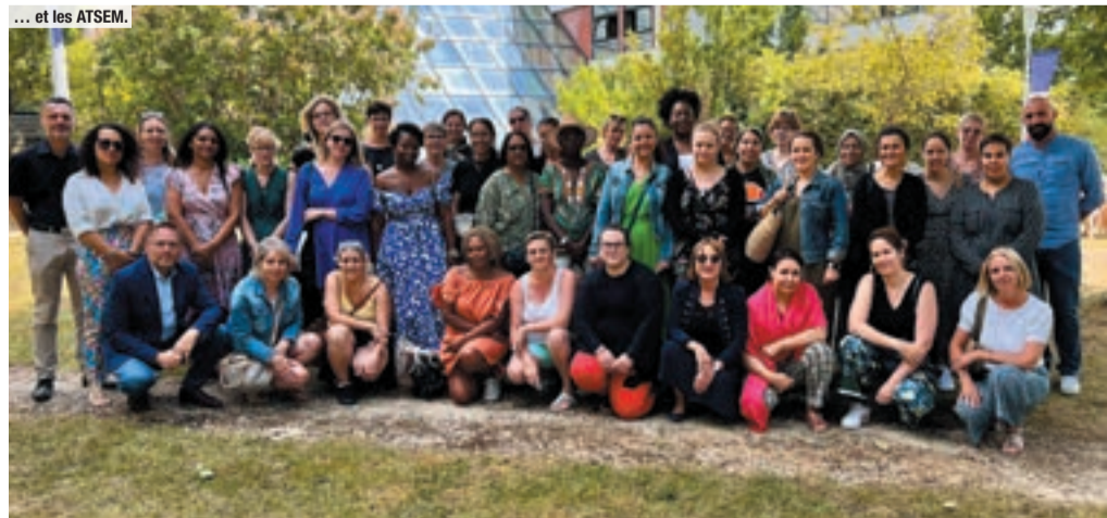
... et les ATSEM.