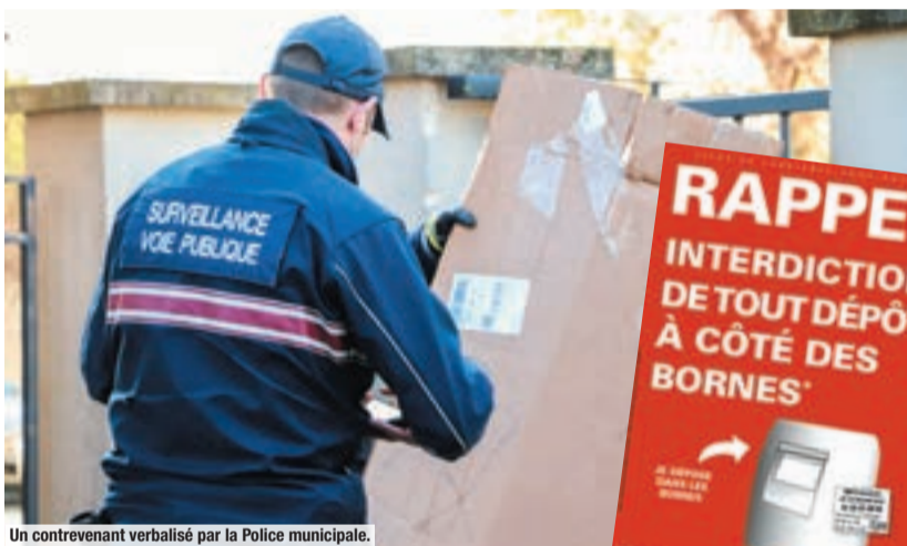
Un contrevenant verbalisé par la Police municipale.