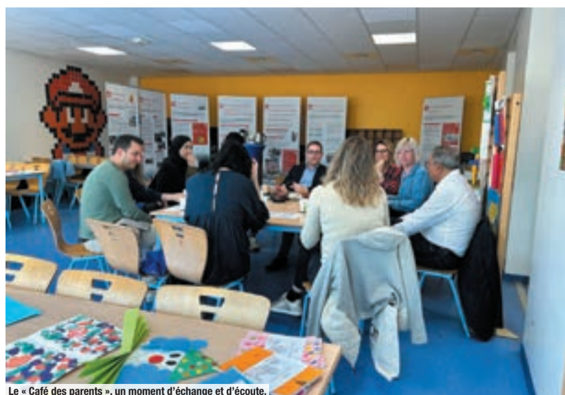
Le « Café des parents », un moment d'échange et d'écoute.