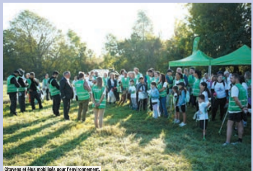
Citoyens et élus mobilisés pour l'environnement.

Chaque année, les Carriérois, toutes générations confondues, s'arment de gants, de pinces et de courage afin de participer à l'opération nationale « Berges Saines » organisée par la municipalité avec l'association La Seine en Partage et l'Association des maires de France et des présidents d'intercommunalité. En moyenne 500 kg de déchets sont ramassés par les participants, des conseillers de quartier et plusieurs enfants – dont certains du Conseil local de la jeunesse – qu'il faut tout particulièrement remercier pour leur engagement.