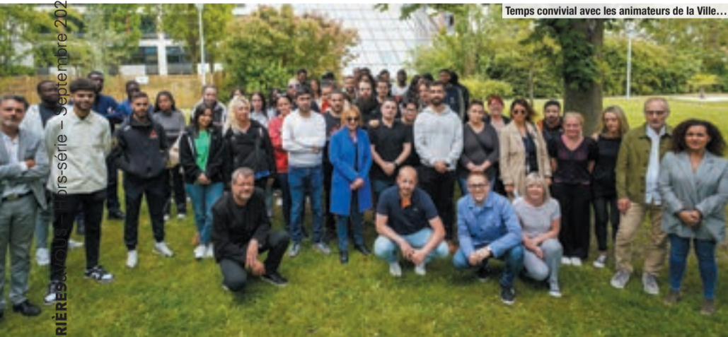
Temps convivial avec les animateurs de la Ville...