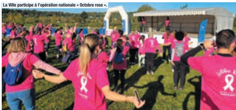
La Ville participe à l'opération nationale « Octobre rose ».