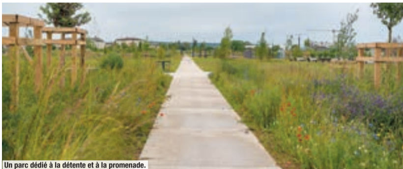
Un parc dédié à la détente et à la promenade.

Ce parc urbain a été pensé pour devenir « l'élément fédérateur entre les nouveaux quartiers et la Ville historique ». Il a vocation à les relier à la Seine en passant par le Parc du Peuple de l'herbe ainsi qu'aux futurs équipements initiés par l'équipe municipale : halle du marché, route départementale requalifiée, projet de lycée en cours avec la Région Île-de-France. Les usagers du parc pourront également profiter de la passerelle dédiée aux mobilités douces reliant Poissy et Carrières-sous-Poissy.