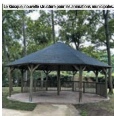
Le Kiosque, nouvelle structure pour les animations municipales.