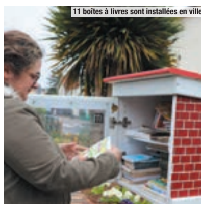
11 boîtes à livres sont installées en ville.