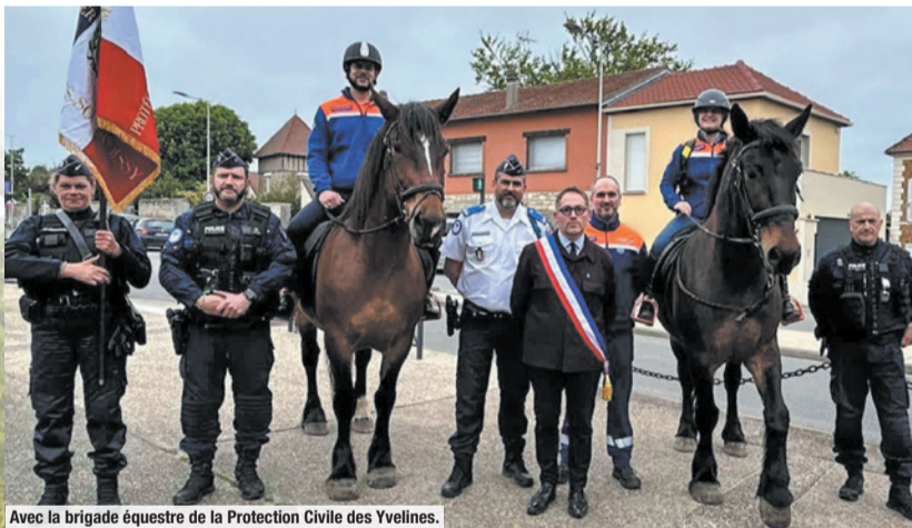
Avec la brigade équestre de la Protection Civile des Yvelines.