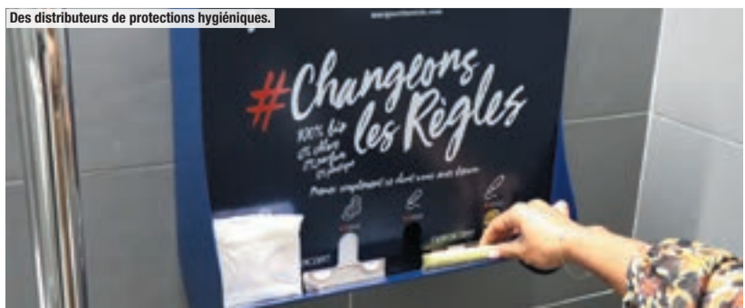
Des distributeurs de protections hygiéniques.