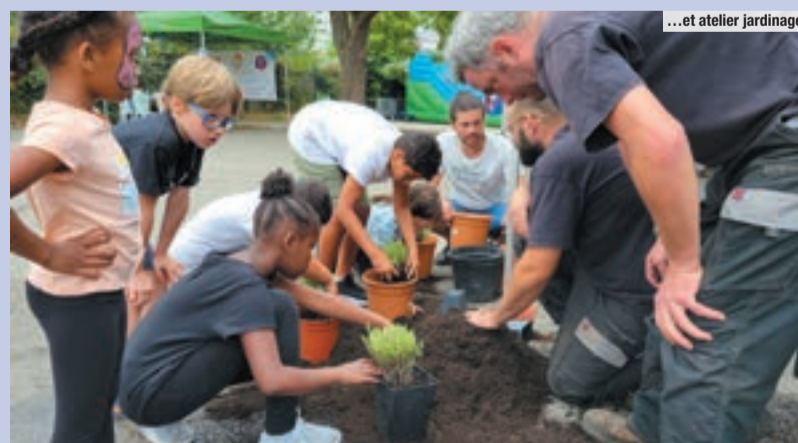
...et atelier jardinage.