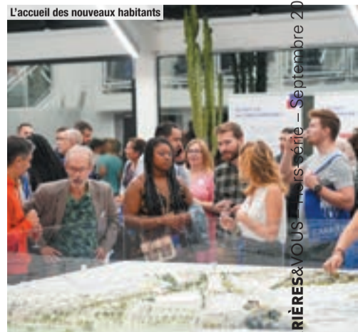
L'accueil des nouveaux habitants