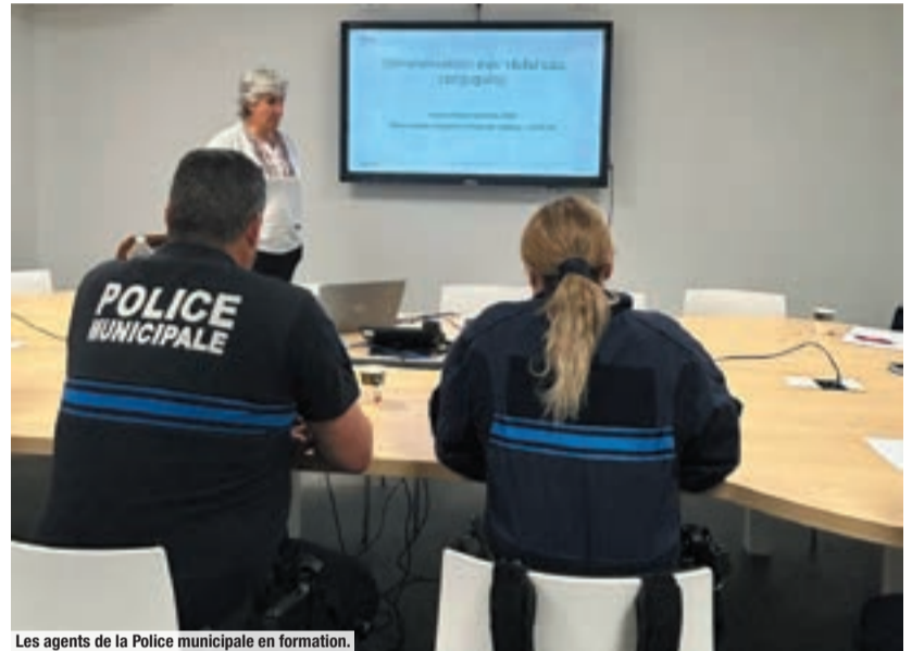
Les agents de la Police municipale en formation.