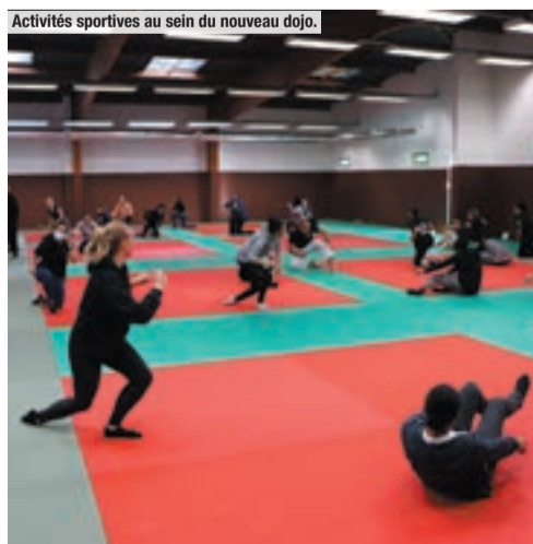
Activités sportives au sein du nouveau dojo.