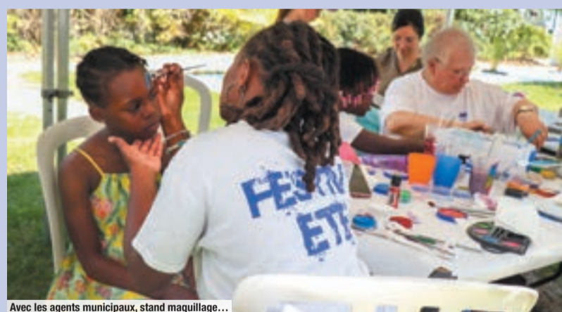
Avec les agents municipaux, stand maquillage...